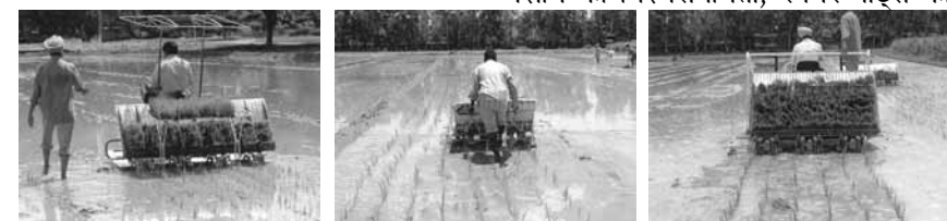
चित्र-1. संचालन में स्वचालित एकल-पहिया प्रकार धान रोपाई मशीन का दृश्य (बायीं ओर), संचालन में स्वचालित पैदल चलित प्रकार धान रोपाई मशीन (मध्य में), संचालन में स्वचालित 4-पहिया प्रकार धान रोपाई मशीन (दायीं ओर)

अध्ययनों से पता चला है कि यांत्रिक रोपाई प्रणालियों में मैट नर्सरी तैयार करना कुल ऊर्जा आवश्यकता का एक पर्याप्त हिस्सा है, जो हस्त रोपाई में उपयोग की जाने वाली पारंपरिक नर्सरी के ऊर्जा हिस्से से काफी अधिक है। ट्रे भरने, बुवाई, सिंचाई और मैट संभालने में शामिल अतिरिक्त कार्य श्रम और ऊर्जा इनपुट को और